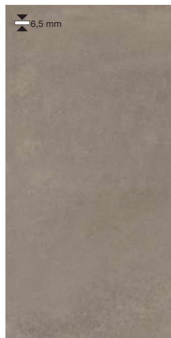
120x240 - 47 1/4 x 94 1/2 C4F87R TAUPE NAT. RETT. ● 112