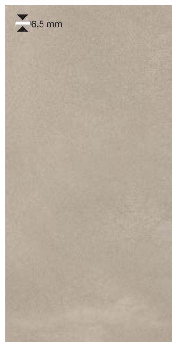
120x240 - 47 1/4 x 94 1/2 C4F83R SAND NAT. RETT. ● 112