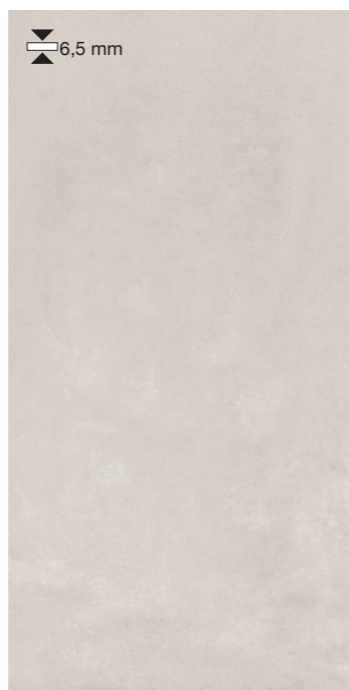
120x240 - 47 1/4 x 94 1/2 C4F80R WHITE NAT. RETT. ● 112