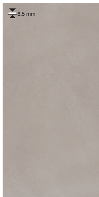
120x240 - 47 1/4 x 94 1/2 C4F88R GREY NAT. RETT. ● 112